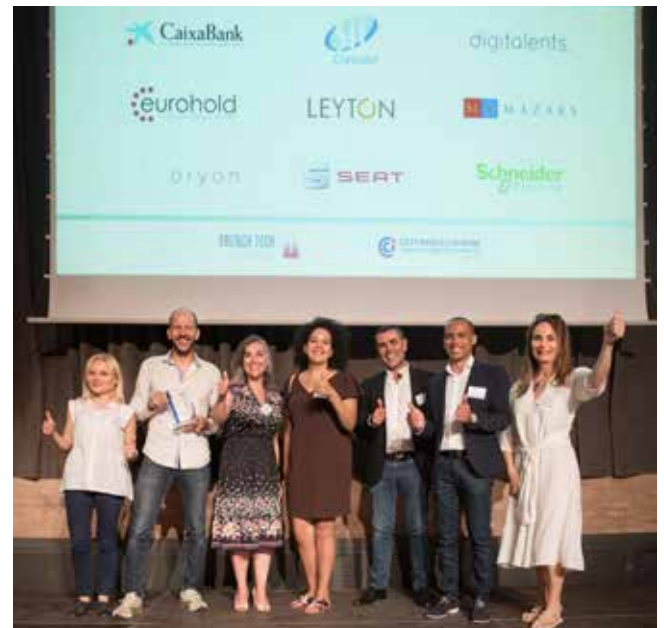
↑ Finalistas del III Prix Entrepreneur Tech.

Nuestro objetivo es establecer contacto con cualquier compañía miembro de la Cámara, conocer sus necesidades de imágenes de comunicación o entrenamiento y ver como Draagu puede ayudarlos, por supuesto, con un descuento interesante para ellos.