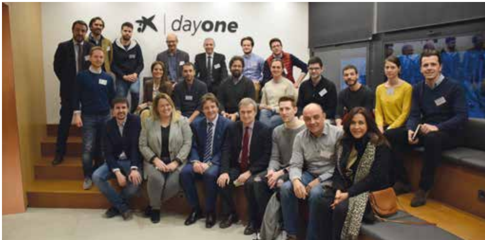
Los participantes a la reunión.